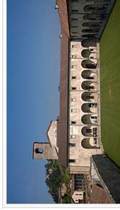
Chiostro interno dell'ex-monastero di Sant'Agostino, oggi sede del Dipartimento di Scienze umane e sociali