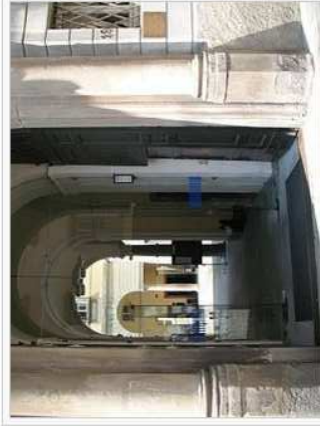
Ingresso principale di Via Salvecchio, sede del Rettorato e del Dipartimento di Lingue, Letterature Straniere e Comunicazione

L'Università degli Studi di Bergamo ha sei sedi, dislocate nella città di Bergamo e a Dalmine.