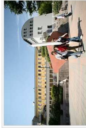
Facciata dell'Edificio B, parte del Campus di Ingegneria a Dalmine (BG)