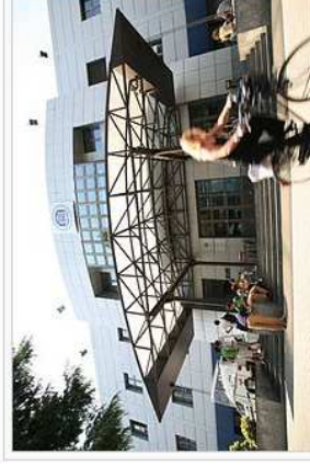
Esterno dell'edificio di Via dei Caniana, sede del Dipartimento di Scienze aziendali, economiche e metodi quantitativi, e del Dipartimento di Giurisprudenza