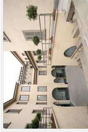
Cortile interno della sede di Piazza Rosate, Dipartimento di Lingue, Letterature Straniere e Comunicazione