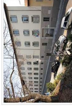
Esterno dell'ex Collegio Baroni, oggi sede del Dipartimento di Lettere e Filosofia in Via Pignolo.